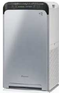
前面パネル:シルバー/本体:ホワイト